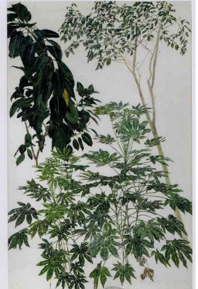
Sam Szafran (1934-2019), Sans titre. Aquarelle sur papier, 74 x 47,7 cm.