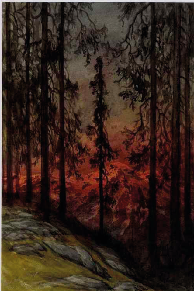
Gustave Doré (1832-1883), Soleil couchant en haute montagne, vers 1870. Aquarelle et gouache, 40 x 27 cm.