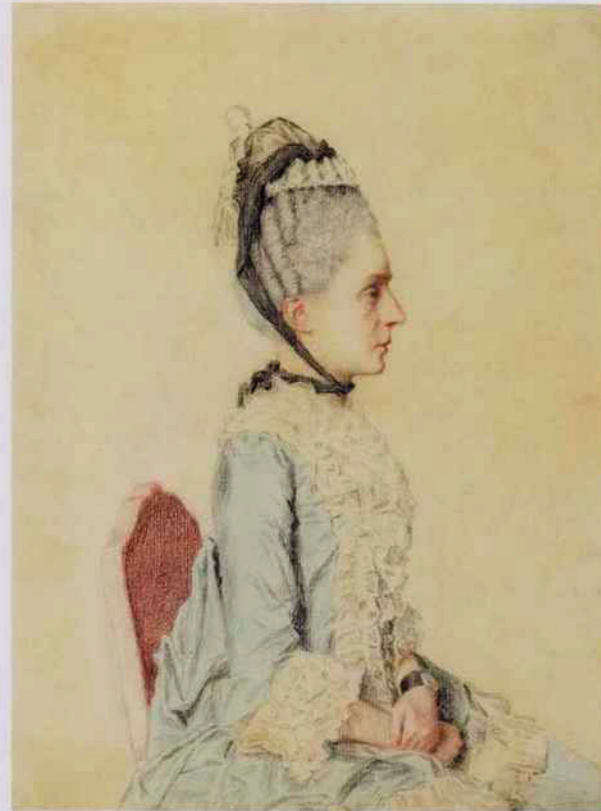
Jean-Étienne Liotard (1702-1789), Portrait de femme assise, vue de profil (côté droit). Craie noire et rouge, rehauts de blanc sur papier vergé blanc, 22,8 x 17,3 cm.