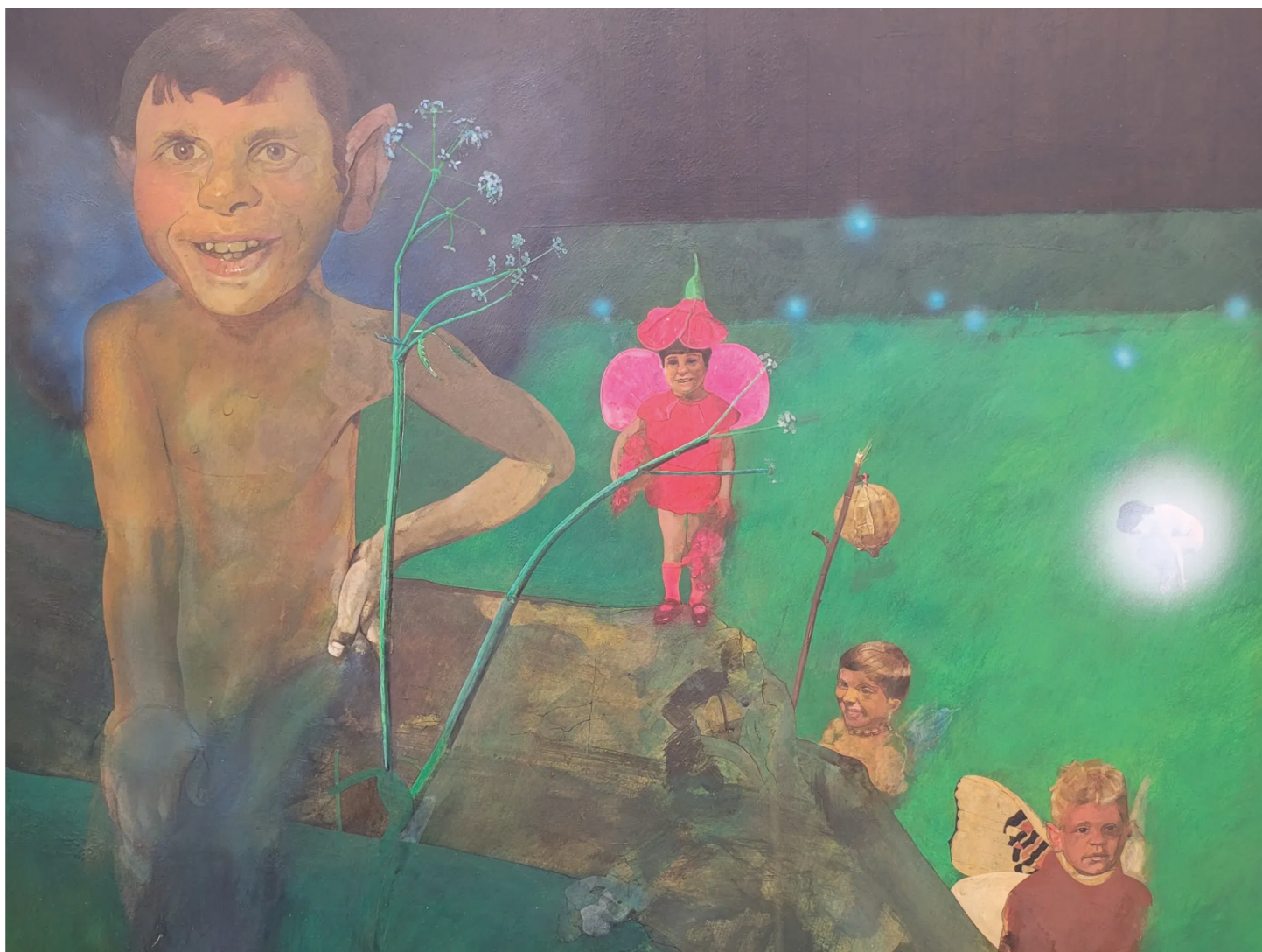
Peter Blake, Puck, Peaseblossom, Cobweb, Moth and Mustard Seed, 1969-1984.