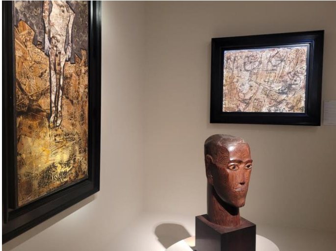
Ossip Zadkine, Tête d'homme , 1928. Galerie Hélène Bailly.