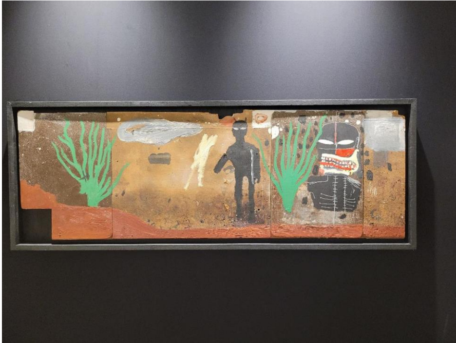
Jean-Michel Basquiat, Blue Skies , 1985. Galerie Zidoun-Bossuyt.