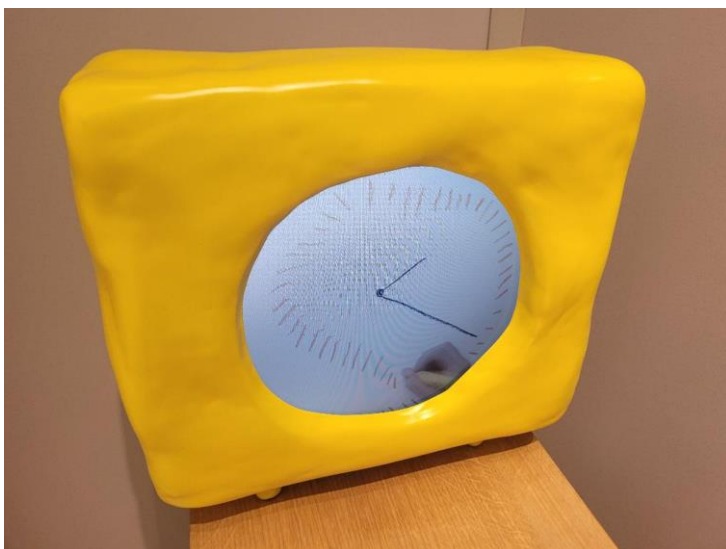
Maarten Baas, Children's Clock , 2022, édition de 101. Carpenters Workshop Gallery.

Célébrations autour du surréalisme oblige en Belgique, la galerie De Jonckheere (Genève) a notamment sorti ce rare dessin de Magritte inspiré de La Légende des siècles de Victor Hugo. Une vision puissante que l'on peut s'offrir pour 600 000 euros.