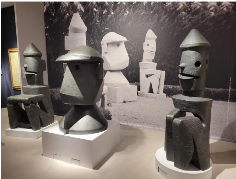
Max Ernst, Corps enseignant pour une école de tueurs , 1967, bronze, fonte 2020. DIE Galerie.

C'est l'un des plus jolis visages de la Brafa cette année. La galerie Hélène Bailly (Paris) a apporté cette rare tête en bois du sculpteur Ossip Zadkine, dont elle demande 580 000 euros.