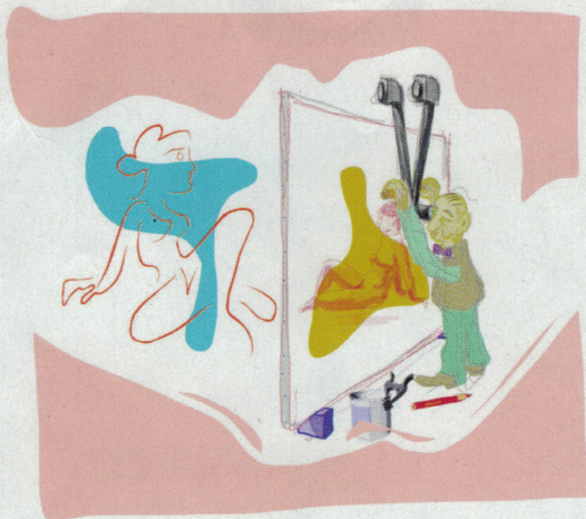
IVAN MESSAC, LOOKING FOR DAVID , 2016, DESSIN NUMÉRIQUE SUR TOILE, 160 X 175 CM. COURTESY IVAN MESSAC & ART TO BE GALLERY

L'association d'antiquaires et de galeries d'art du VII e arrondissement parisien présente un parcours artistique sur le thème féminin. Cet événement s'inscrit dans le cadre de « 7 jours à Paris », en collaboration avec D'Days, la Nocturne Rive Droite et Art Saint-Germain-des-Prés. On y retrouvera aussi bien la femme artiste, représentée à travers ses œuvres – céramiques, peintures, sculptures ou photographies –, que le modèle. Seront présentées des pièces de l'Antiquité à la création contemporaine, en passant par la Haute Époque, retraçant l'évolution de la place des femmes à travers le temps et l'histoire de l'art. Du 31 mai au 4 juin , vernissage le 31 mai, 18 h-22 h, galeries quai Voltaire, rue des Saints-Pères, de l'Université, du Bac, de Beaune, de Verneuil, de Lille, Paris VI e et VII e , www.carrerivegauche.com