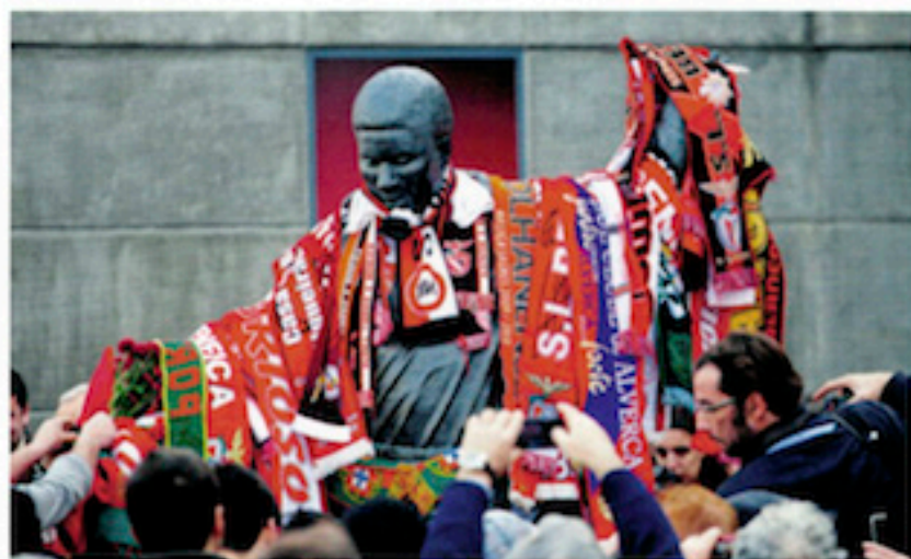
Le célèbre footballeur portugais Eusebio da Silva Ferreira, décédé en janvier 2014, à l'âge de 71 ans. À cette nouvelle, ses admirateurs décorèrent avec les écharpes de son club Benfica Lisbonne la statue qui le représente devant le stade Estádio da Luz à Lisbonne.

L'Euro 2016 dans les musées ; les nouvelles têtes de l'Académie ; le pavillon français de la Biennale de Venise ; le Musée des beaux-arts de Montréal s'agrandit... Toute l'actualité de juin est dans L'Œil.