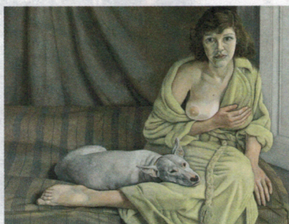
GIRL WITH A WHITE DOG, LUCIAN FREUD, 1950-1951.

Bacon, Freud et la Escuela de Londres, Museo Picasso Málaga, jusqu'au 17 septembre. Tél. +34 952 127 600. www.museopicassomalaga.org