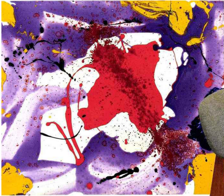
2_Sam Francis, Quiet Eye , 1986, acrylique sur toile, 50 x 60,6 cm.